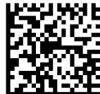
GS1 Digital Link