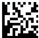
GS1 Data Matrix