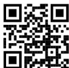
GS1 QR Code