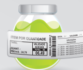
Exemplo de aplicação