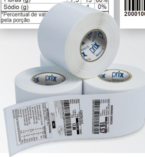
Layouts de etiquetas ilustrativos.